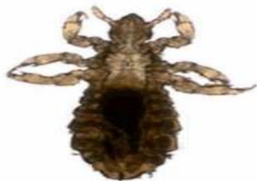
Poux de tête adulte

Pour plus de renseignements, vous pouvez consulter l'info-santé de votre C.L.S.C. Direction de la santé publique de l'Outaouais